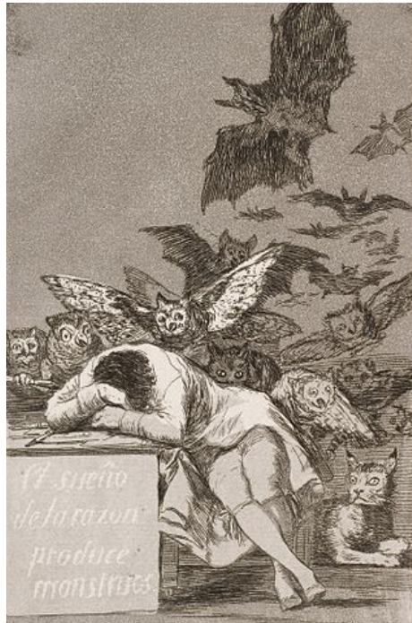
Francisco de Goya, El sueño de la razón produce monstruos , grabado n.º 43 Serie Los Caprichos (1797-1799).

Estas contradicciones llevaron a luchas, guerras e invasiones que desafiaron los ideales ilustrados de libertad, igualdad y fraternidad. Por ejemplo, las guerras e invasiones napoleónicas, que se llevaron a cabo en nombre de la razón y la libertad, causaron sufrimiento y destrucción en muchas partes de Europa. Por lo tanto, es importante reconocer tanto los logros como las limitaciones de la Ilustración para comprender su legado y sus implicaciones en la sociedad contemporánea.