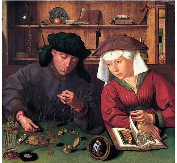
Quentin Massys, El cambista y su mujer (1515).

El surgimiento de la burguesía como clase social es un fenómeno histórico que se desarrolló a lo largo de la Edad Moderna y que tuvo un papel fundamental en la construcción de la Modernidad . El concepto proviene de aquellos individuos que desarrollaban su actividad en las ciudades (o burgos). Según Revueltas (1990), la burguesía se consolidó junto con el proceso global de acumulación, en medio de luchas y enfrentamientos contra la nobleza y el sistema feudal, lo que le confirió un papel activo y revolucionario.